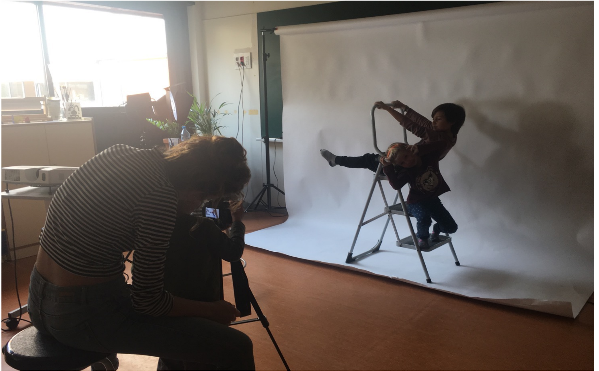
Espais de joc