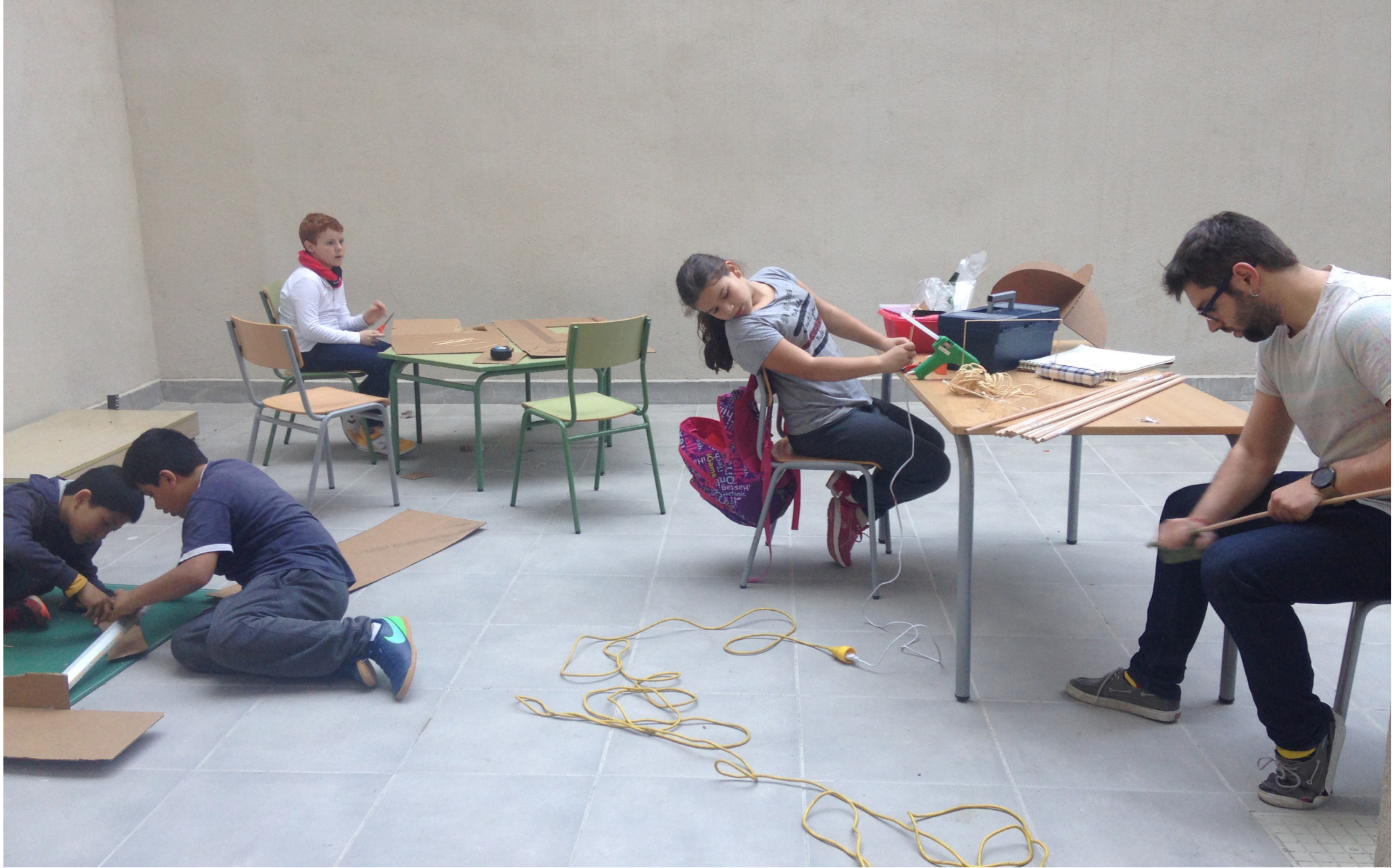
Espais de co-creació