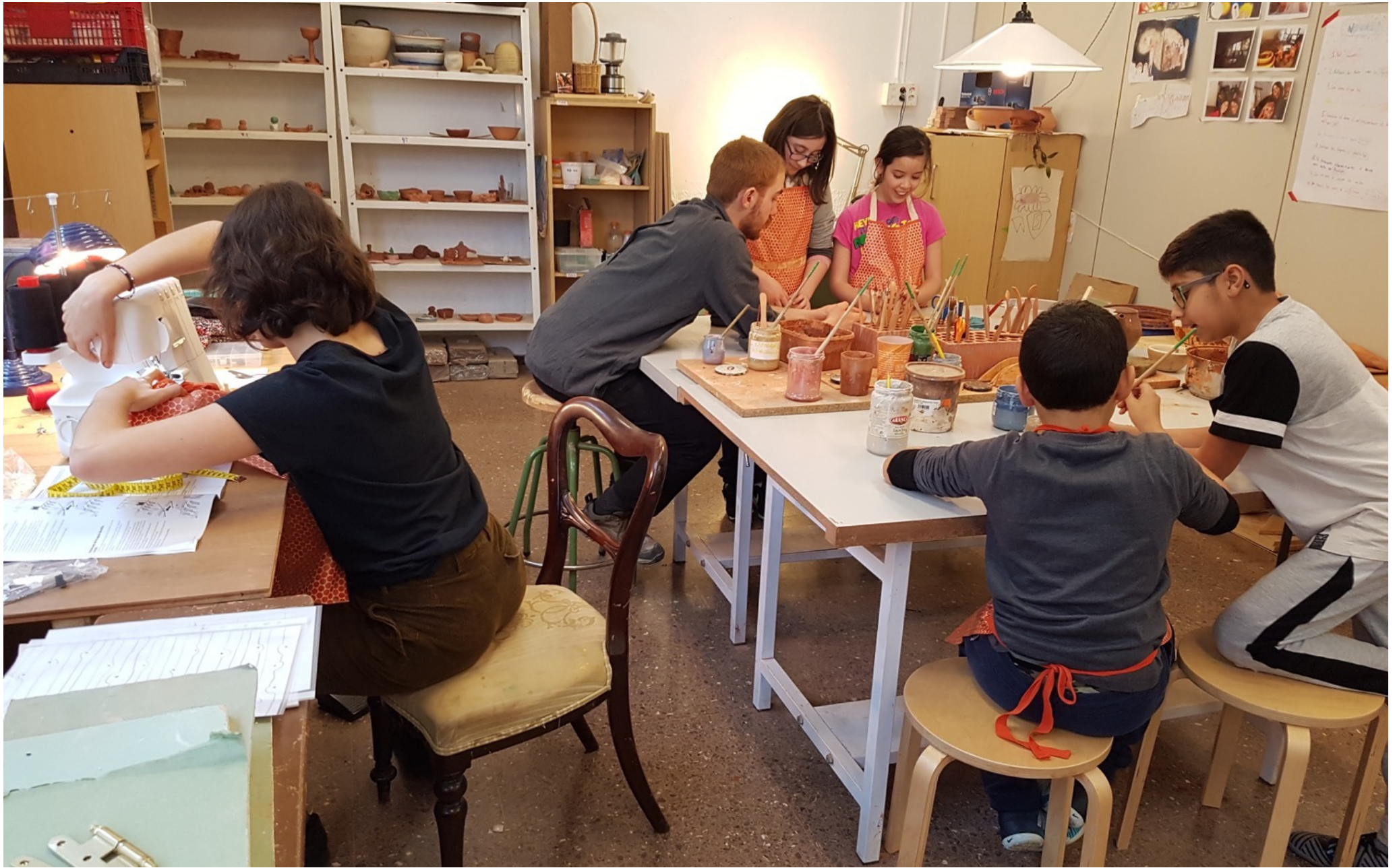
Espais d'aprenentatge experiencial