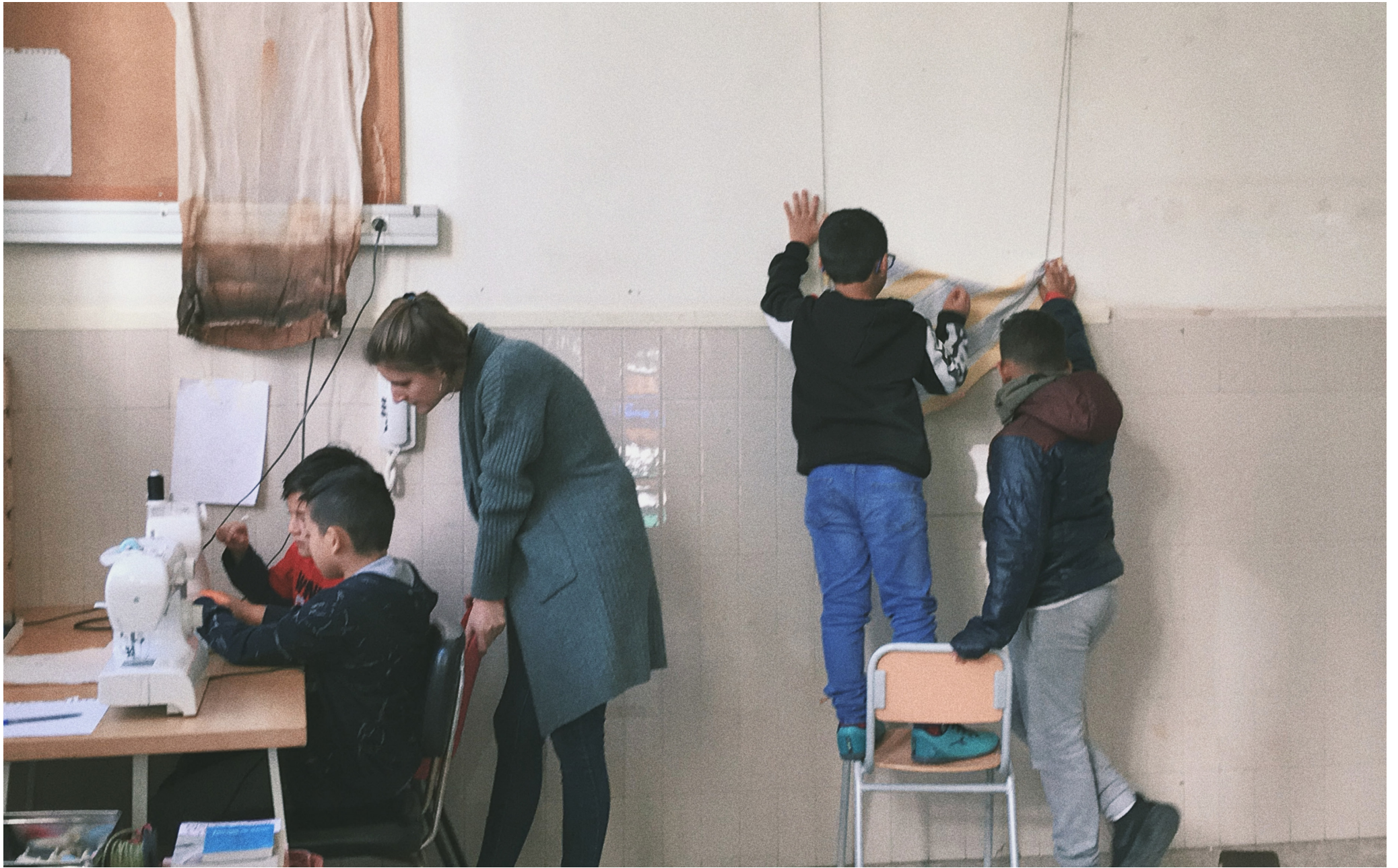
Espais de processos i resultats