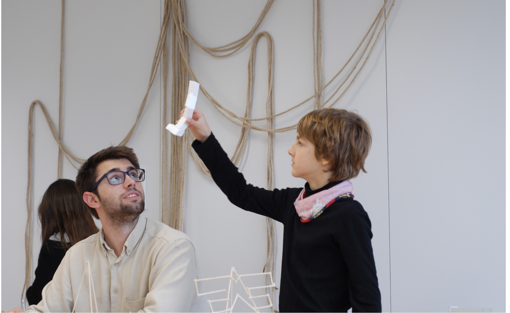
Espais de fantasia