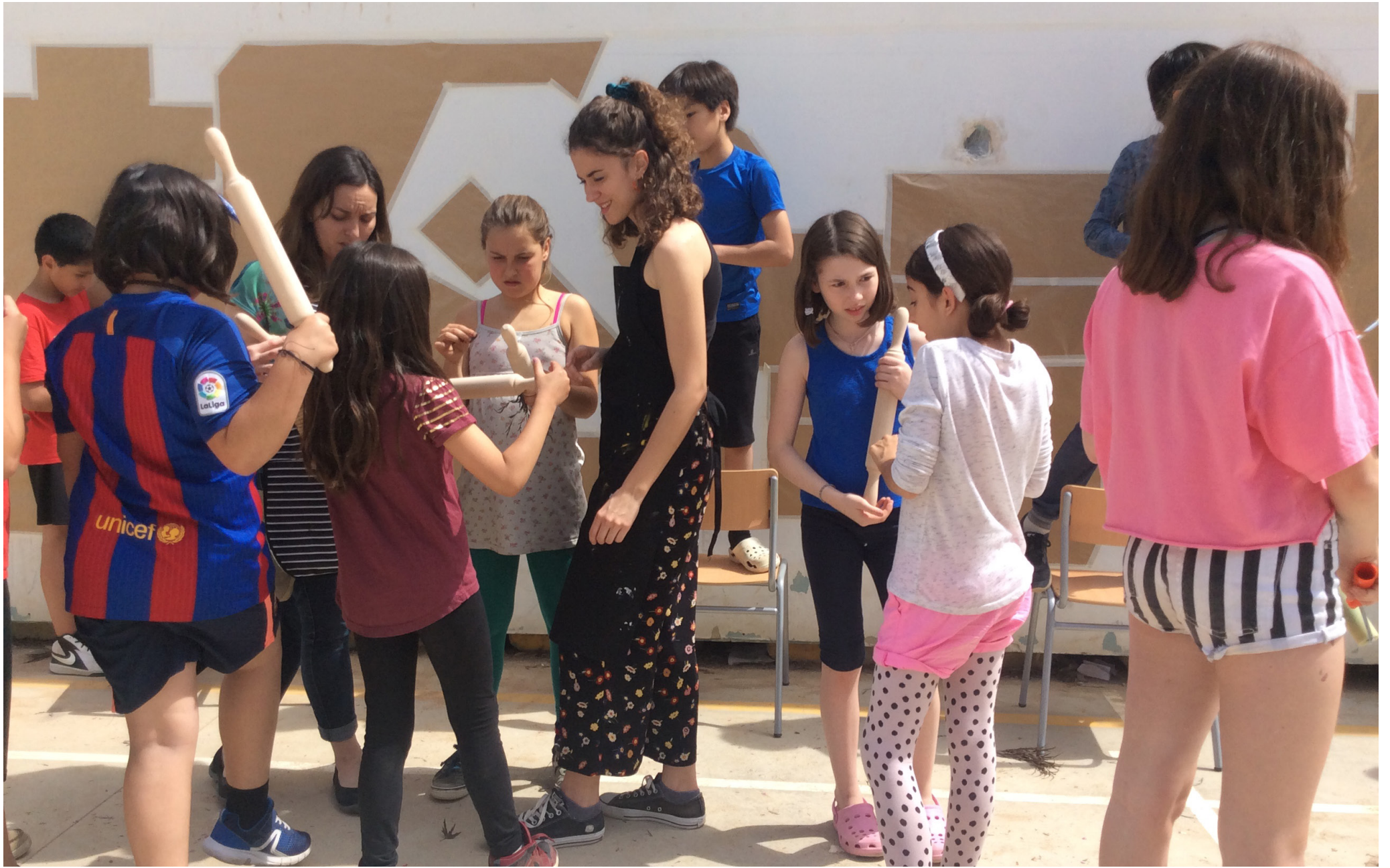
Espais de co-responsabilitat