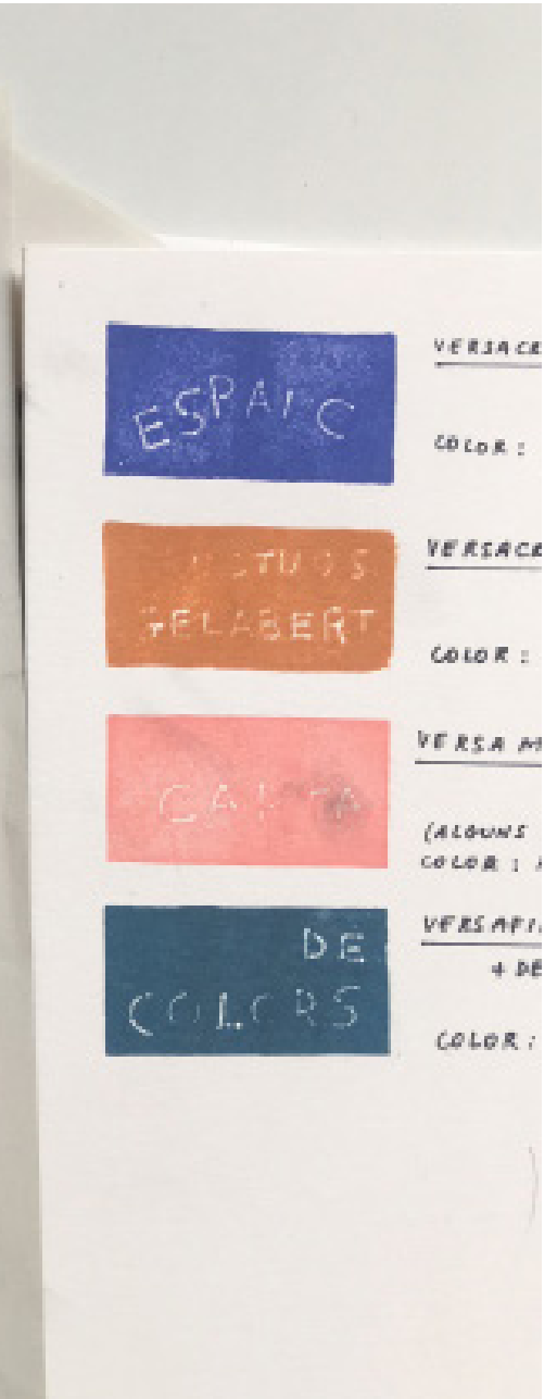
Espais de pensament