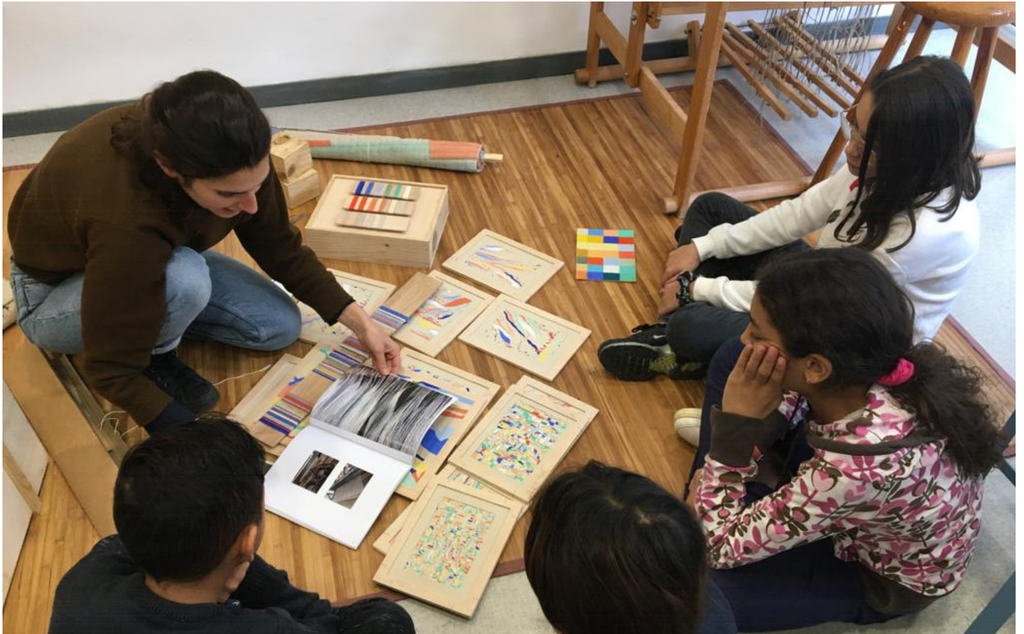
Espais de recerca