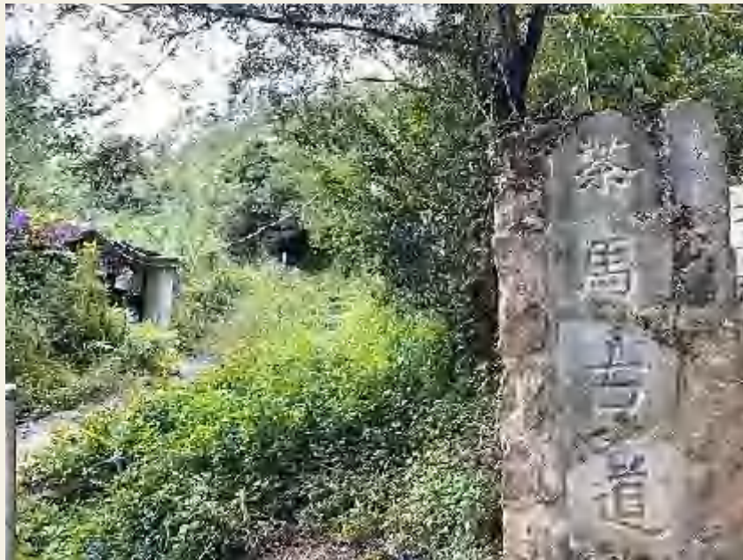
*Antica via del tè – Il Monte Jimpao (Yunnan, Cina)

Percorso storico di scambi commerciali legato alla diffusione del tè