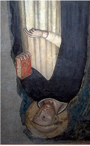
Affresco di Viale da Bologna, ritenuta la più antica immagine di San Domenico, Bologna, Basilica di San Domenico.

L'ordine domenicano è il depositario della dottrina di san Tommaso, che vuole realizzare in terra l'ordine razionale e gerarchico del pensiero di Dio. Il 22 dicembre 1216 Papa Onorio III approvò la regola dell'ordine fondato da Domenico di Guzmán, che così fanno successivo crebbe fino a riuscire ad inviare frati nei principali centri europei, primi fra i quali Bologna e Parigi, città popolose e sedi di università. Domenico giunse a Bologna nel gennaio del 1218, stabilendosi insieme ai suoi frati nel convento di una chiesa che allora era fuori le mura, dedicata a Santa Maria della Purificazione, nota col nome della Mascarella.